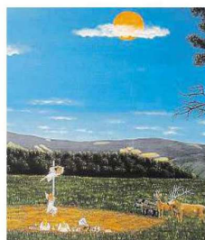
Výřez z obrazu „Vily tančí u tyče“.

Tehdy měl ještě stavební firmu specializovanou na památky a spoustu starostí a ní také malování se pro něj stalo příjemným odpočinkem, na který ale neměl zrovna moc času. V Šemanovicích na Kokořínsku si navíc pořídil starý statek s roubeným stavením, které se jal rekonstruovat a později se tam přestěhoval. Teď v této malé kokořínské vesce žije už patnáct let.