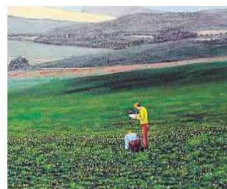
Výřez z obrazu „Sčítání kobyлек lučních...“ AUTOR | ZK PETR PĚNKAVA

slanec ve Švýcarsku mu slibil, že se bude moci do alpské země zase vrátit, nestalo se tak. Komunistický režim ho zpátky za hranice už nepustil. Do Švýcarska se proto opět podíval až potom, co padla železná opona. Byl překvapen, že jeho obrázky byly stále výzdobou bytů jeho přátel. Jednomu z nich pak slibil, že mu opět něco namaluje, což jej přivedlo zpátky k umění.